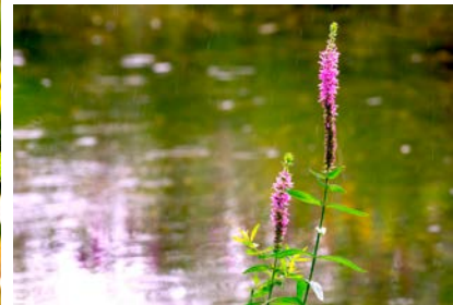
Grosses Bild: Die Pfeifengraswiese wächst auf oberflächlich saurem, oft kalkigem Boden. rechts oben: Mädesüss, rechts unten: Blutweiderich