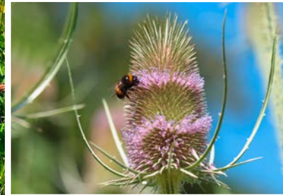
Grosses Bild: Blumenreiche Wiesen leisten einen wichtigen Beitrag zur Erhaltung der Artenvielfalt, rechts oben: Sumpfdotterblume, rechts unten: Wilde Karde