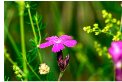
Grosses Bild: Mit fast 60 möglichen Kräuterarten ist die Magerwiese robust und anpassungsfähig. rechts oben: Brunelle, rechts unten: Kartäusernelke