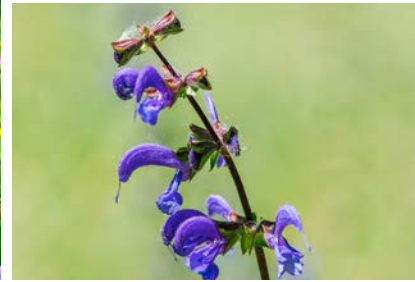
Grosses Bild: Die klassische Fromentalwiese ist die farbigste und blumenreichste Wiese, rechts oben: Wiesen-Flockenblume, rechts unten: Wiesensalbei