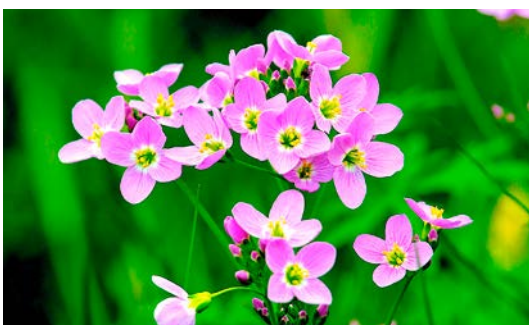
oben: Kriechender Günsel, unten: Wiesenschaumkraut

zusammen, die sonst in Buchenwäldern wächst. Zur Ergänzung der einheimischen Blumen können auch Zwiebeln der Frühlingsblüher wie Scilla oder Narzissen gepflanzt werden.